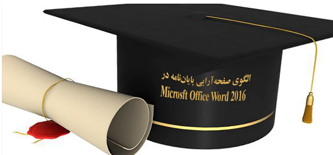
تصویر 3-1. نمونه تصویر در فصل سه

بخش‌های جداگانه آمده است. آنچه در این راهنما می‌آید، دربر گیرنده چگونگی نگارش پارسا است. مخاطبان اصلی این راهنما، دانشجویانی هستند که پارسا را به زبان فارسی می‌نویسند؛ بنابراین، این راهنما برای زبان فارسی است؛ ولی توصیه‌ها و رهنمودهایی نیز برای دانشجویانی که آن‌را به زبان‌هایی همچون عربی، انگلیسی، فرانسه و ... می‌نویسند، در بخش‌های جداگانه آمده است.