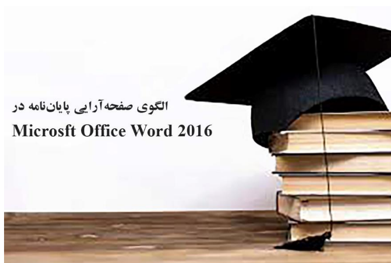
تصویر 1-2. نمونه تصویر در فصل دو

بخش‌های جداگانه آمده است. آنچه در این راهنما می‌آید، دربر گیرنده چگونگی نگارش پارسا است. مخاطبان اصلی این راهنما، دانشجویانی هستند که پارسا را به زبان فارسی می‌نویسند؛ بنابراین، این راهنما برای زبان فارسی است؛ ولی توصیه‌ها و رهنمودهایی نیز برای دانشجویانی که آن‌را به زبان‌هایی همچون عربی، انگلیسی، فرانسه و ... می‌نویسند، در بخش‌های جداگانه آمده است.